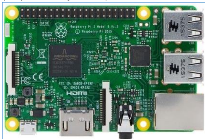
Raspberry Pi op ongeveer ware grootte

Bij bepaalde modellen zijn er mogelijk nog wat verschillen. Zo heeft de versie 3 ook een wifi antenne.